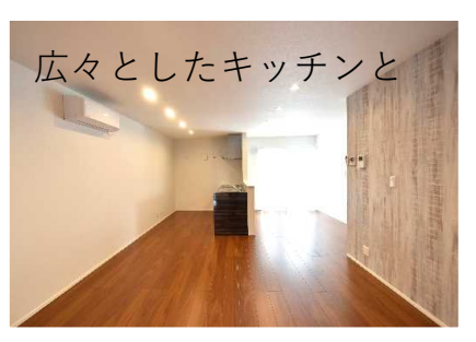
広々としたキッチンと