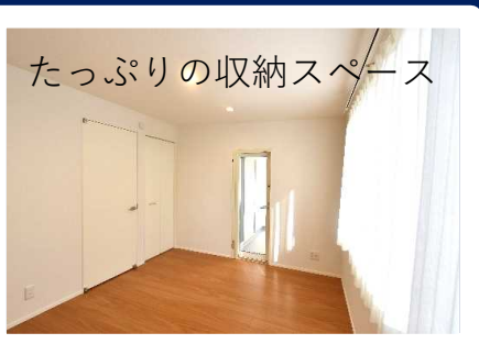
たっぷりの収納スペース